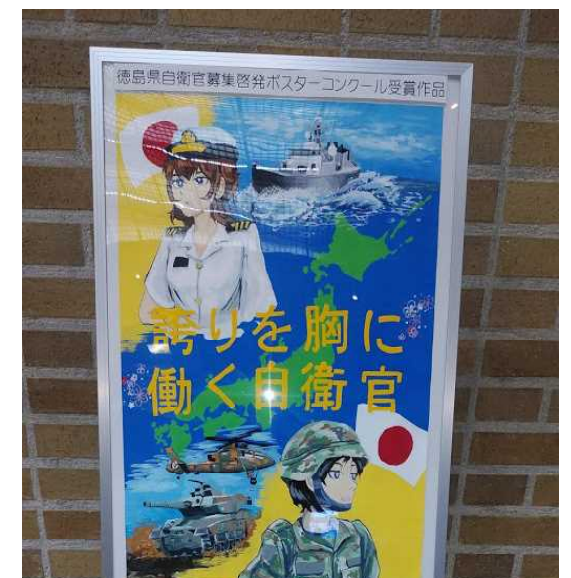
2018年度 知事賞受賞作品