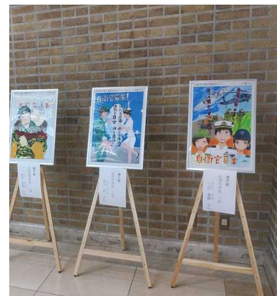
徳島県庁での展示の様子(2月)

「広報宣伝を逸脱していない」と答えるのみで、会が示した中止すべき理由3点について具体的に反論・回答ができないような異常なポスターコンクールは、中止すべきだ。